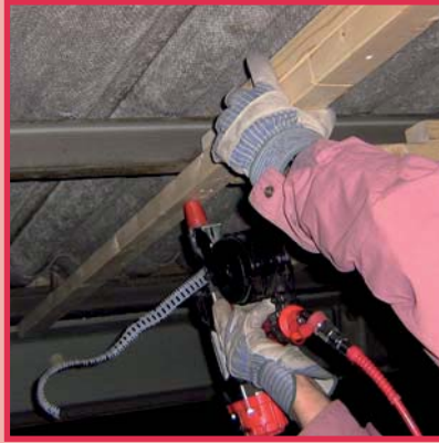
Verbindung Holz und Stahl