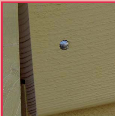
Linsenkopfnagel Holz und Holz