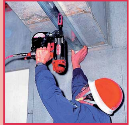
Verbindung C-Profil und Stahl