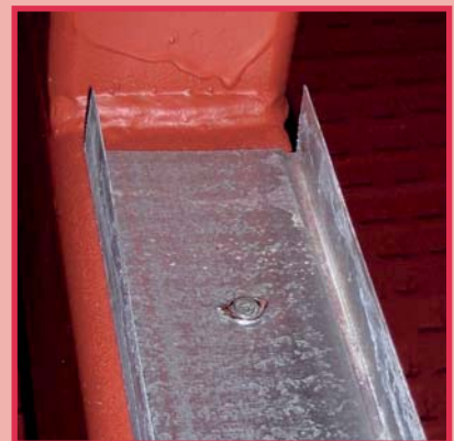
Verbindung C-Profil und Stahl