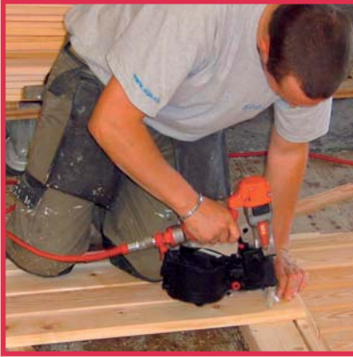
Verbindung Holz und Holz