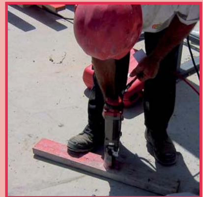
Verbindung Holz und Beton