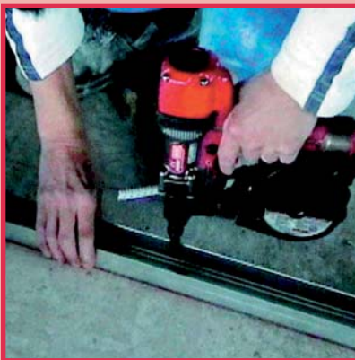
Verbindung C-Profil und Beton